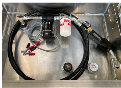
particolare gruppo pompa particular pump group