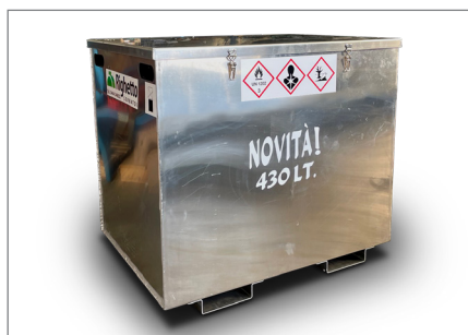
particolare coperchio particular lid