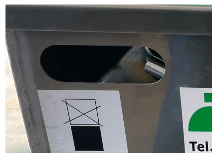
particolare impugnature particular grips