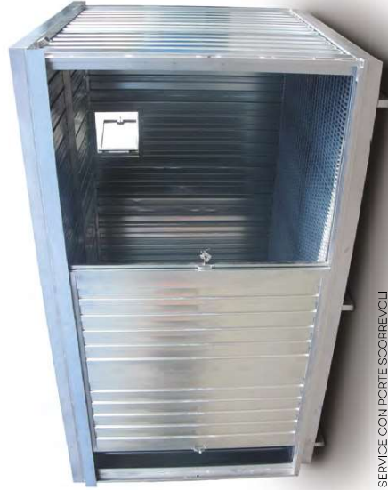
BOX SERVICE CON PORTE SCORREVOLI BOX SERVICE WITH SLIDING DOORS