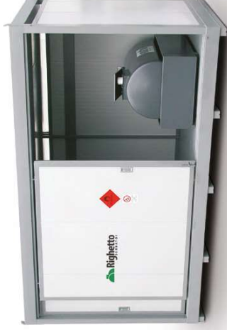
BOX SERVICE CON PORTE SCORREVOLI BOX SERVICE WITH SLIDING DOORS