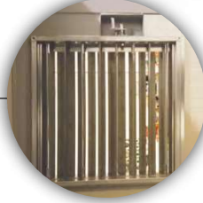
SERRATURA TAGLIAFUOCO FIRE DAMPER