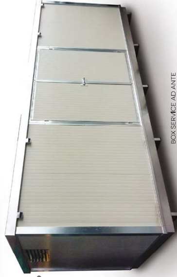
BOX SERVICE AD ANTE BOX SERVICE WITH FRONT DOOR

DISPONIBILI ANCHE IN ALTRE MISURE MORE SIZES AVAILABLE