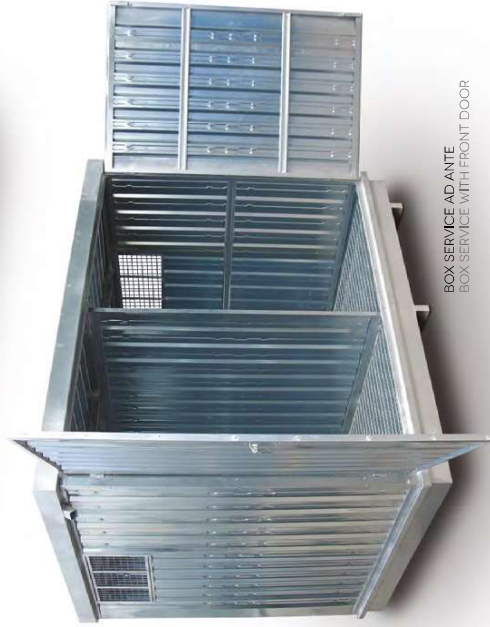
BOX SERVICE AD ANTE BOX SERVICE WITH FRONT DOOR

DISPONIBILI ANCHE IN ALTRE MISURE MORE SIZES AVAILABLE